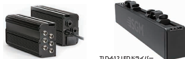
ILD LEDドライバー 品番コード: 80070216