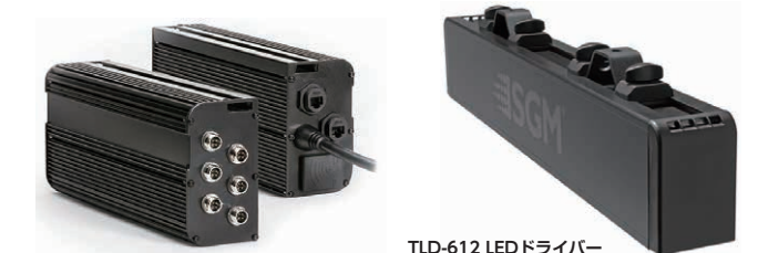
ILD LEDドライバー 品番コード: 80070216