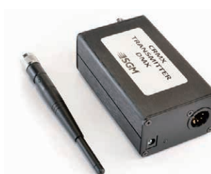
CRMX DMXワイヤレストランスミッター 品番コード: 80070229