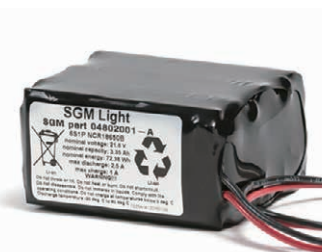
G-1用バッテリー 品番コード: 83061708